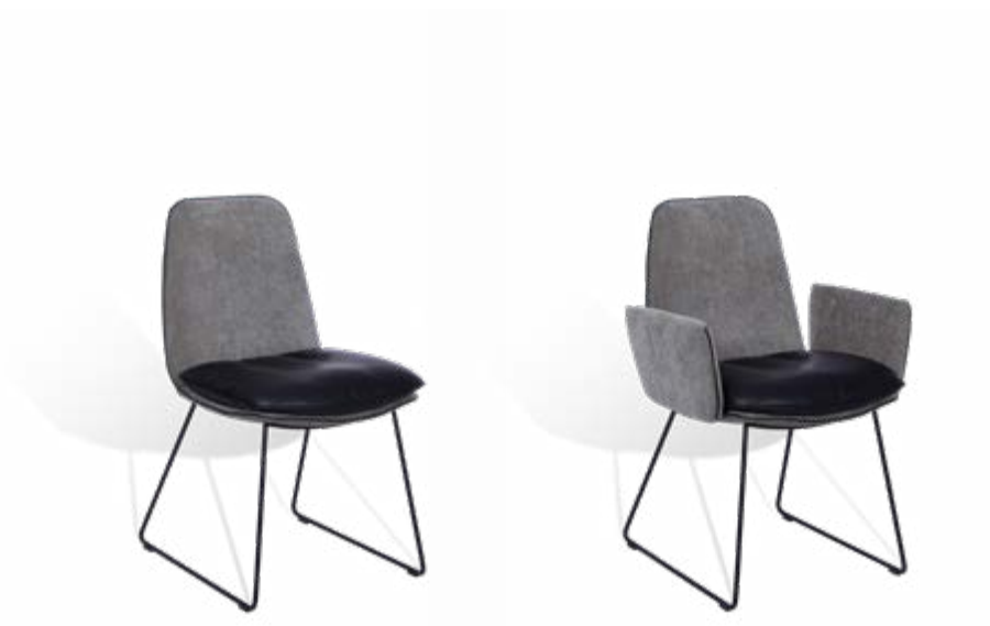
Stuhl ohne oder mit gepolsterten Armlehnen mit Drahtkufengestell Chair without or with upholstered armrests and wire skid frame

Chair without or with upholstered armrests with 4-leg star frame ED – swiveling with return mechanism