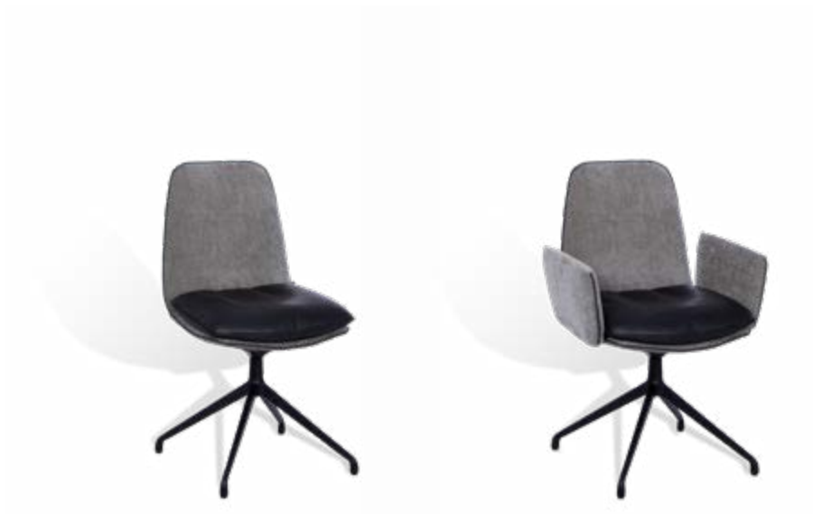
Stuhl ohne oder mit gepolsterten Armlehnen mit 4-Fuß-Sterngestell ED – drehbar mit Rückholmechanik

Chair without or with upholstered armrests with 4-leg star frame ED – swiveling with return mechanism